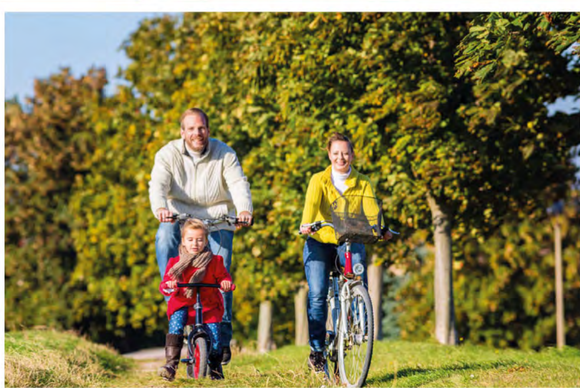
Münster gilt als Paradies für Fahrradfahrer.

DER PERFEKTE ORT FÜR FREUNDE DER NATUR. Wenn Sie Ihre Zeit im Grünen, am Wasser oder unter Bäumen genießen möchten, haben Sie es bei uns nicht weit. Direkt nebenan finden Sie die Ufer der Werse, die zum Angeln einladen. Auf mehreren Kilometern können Sie auf der Werse mit dem Boot oder