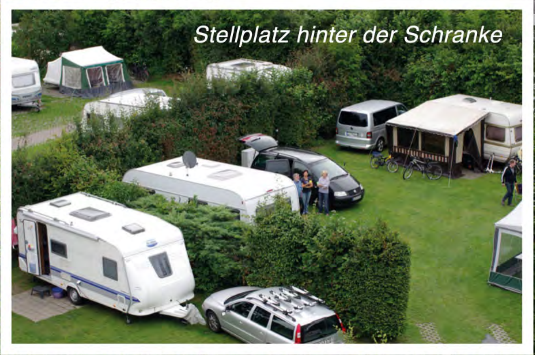
Stellplatz hinter der Schranke