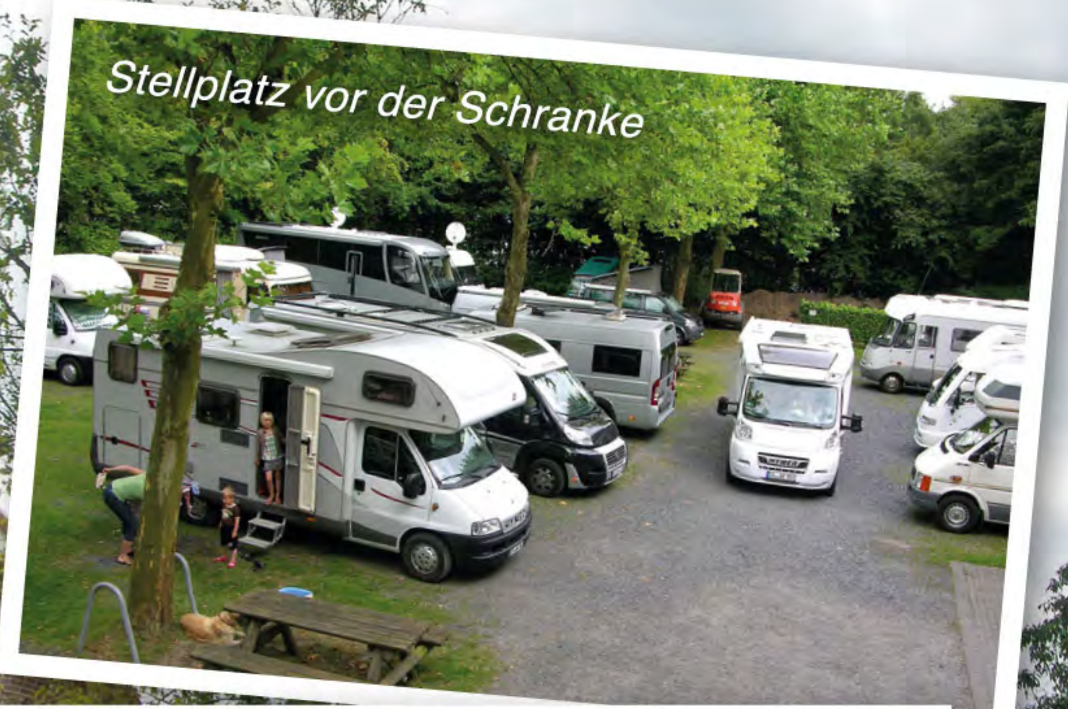
Stellplatz vor der Schranke