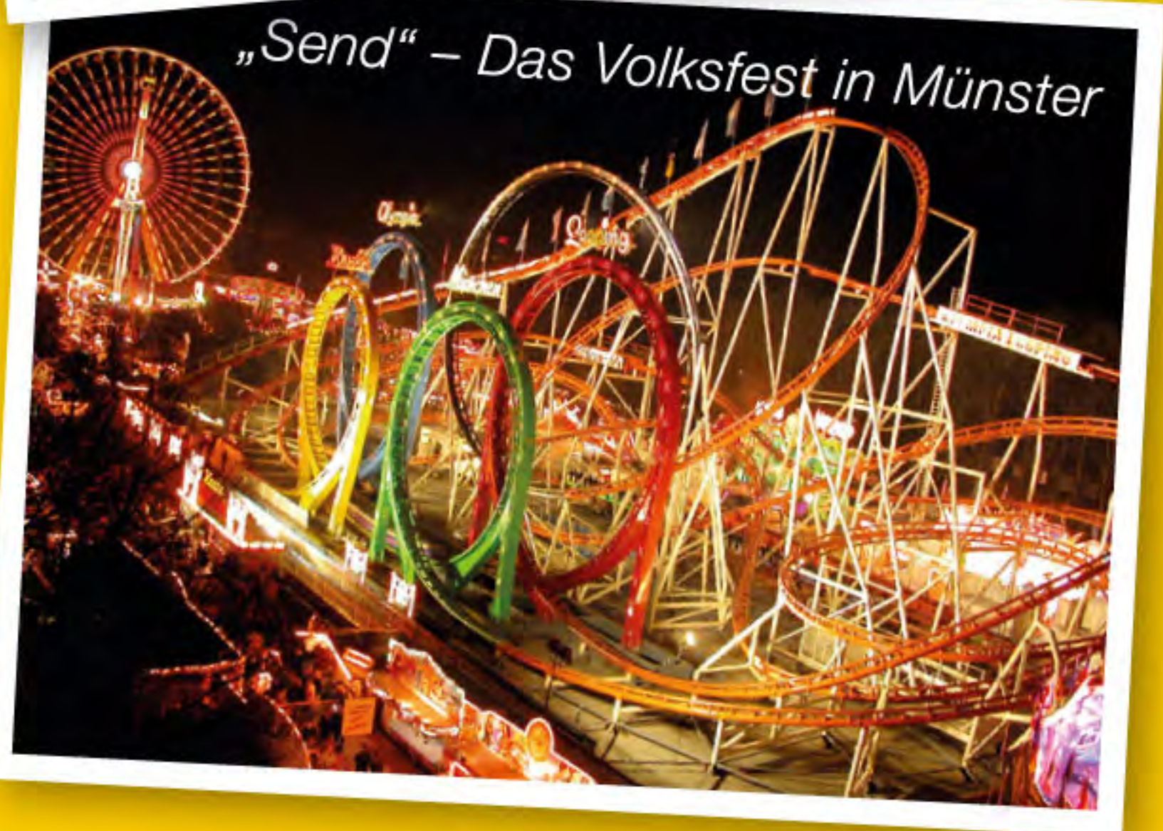
„Send“ – Das Volksfest in Münster